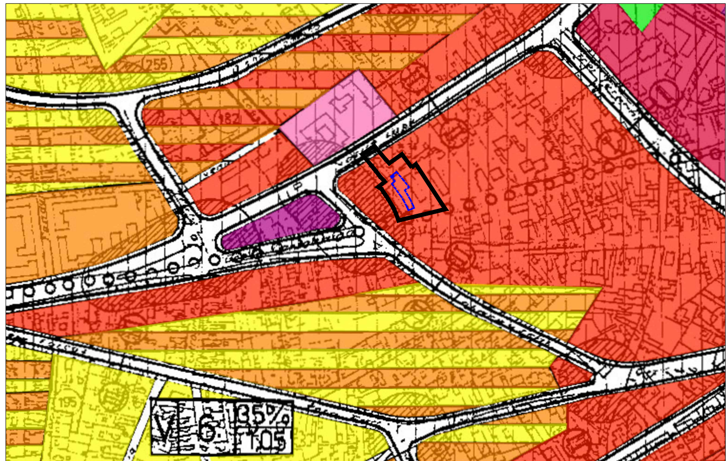
INCADRARE IN PUG 1:5000